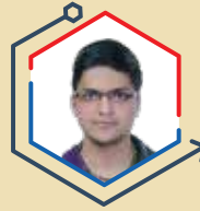
AIR 4 YASH JALUKA