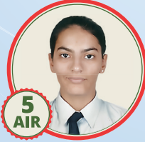
5 AIR Ruhani